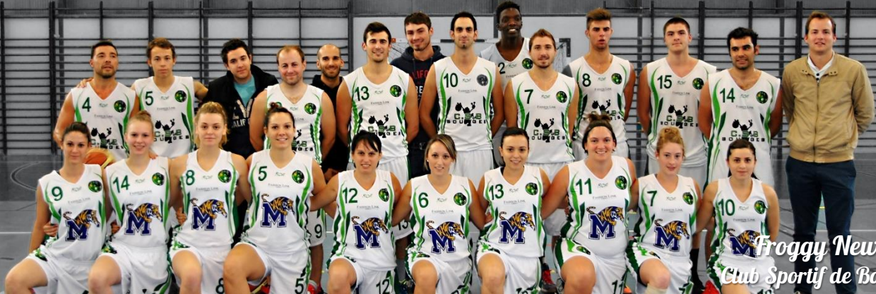
Froggy News#10 Club Sportif de Bourges